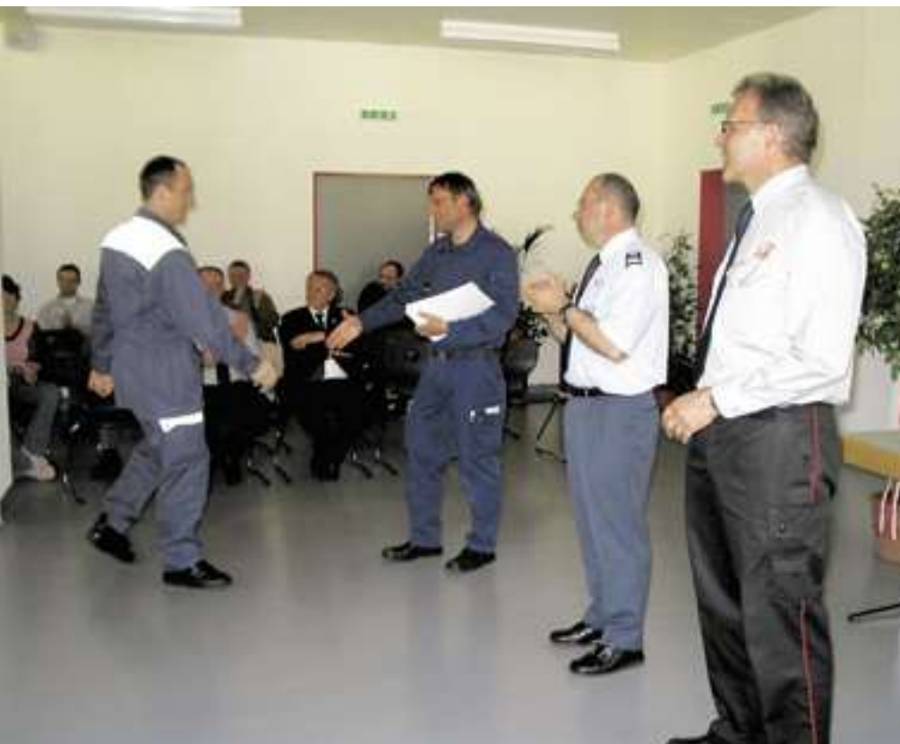
Klassenlehrer bei der Schlussfeier (Zertifikatübergabe)