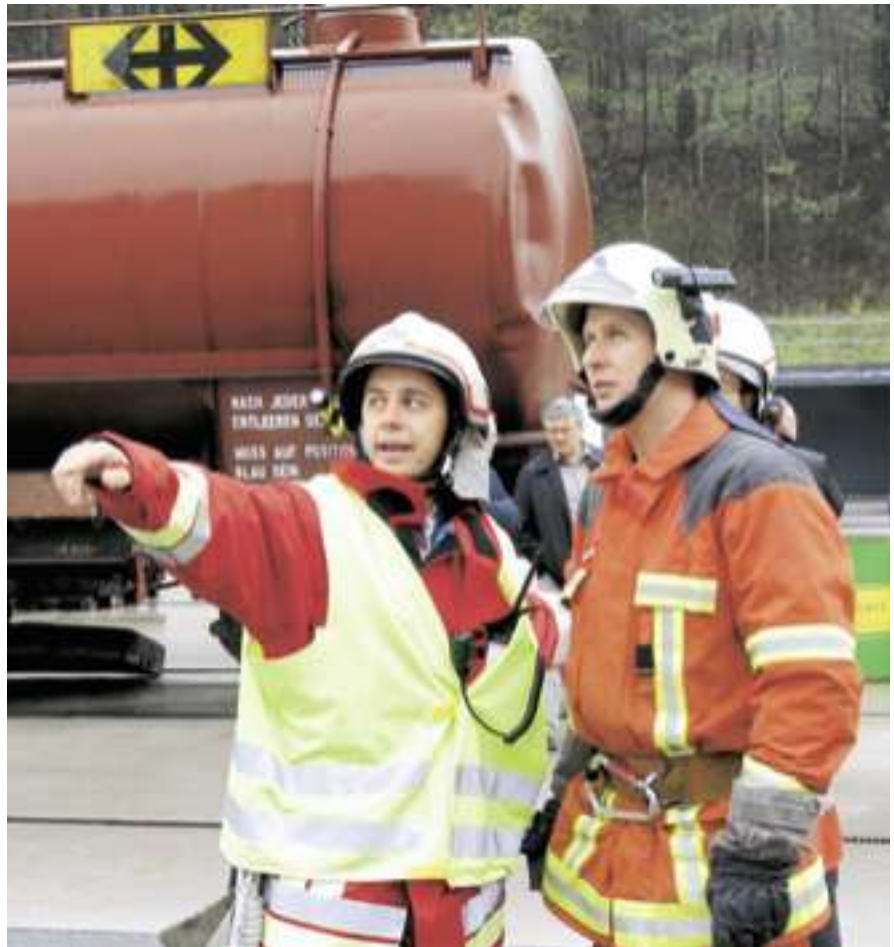
Klarer Auftrag – effizienter Einsatz